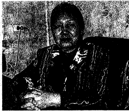
ции района, управления образования.

Я знаю, что коллектив II Нерюктяйинской школы даже в самые сложные времена воплощает в жизнь интересные проекты и программы. Радует, что они находят поддержку со стороны администра-