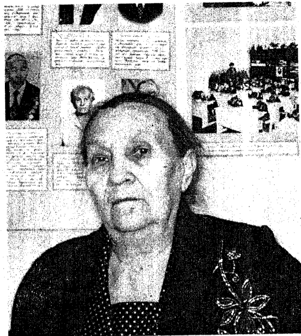
Среди людей немеркнущих профессий, На вечность предьявляющих права, Учителям, как вдохновенной песне, Жить на земле, пока Земля жива.