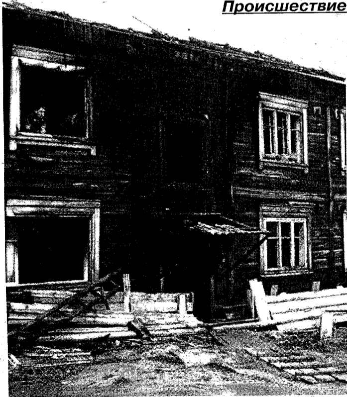
Вчера утром произошло загорание двухэтажного дома по пер. Ленскому, 2 "а". Причины пожара выясняются.